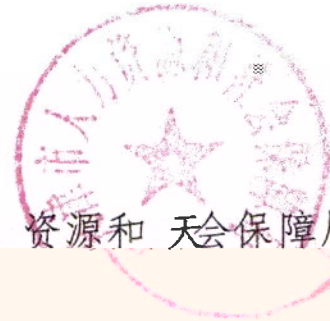
人力资源和社会保障局