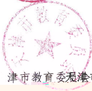
天津市教育委员会